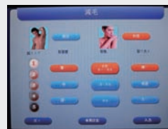
プログラム設定画面(脱毛)