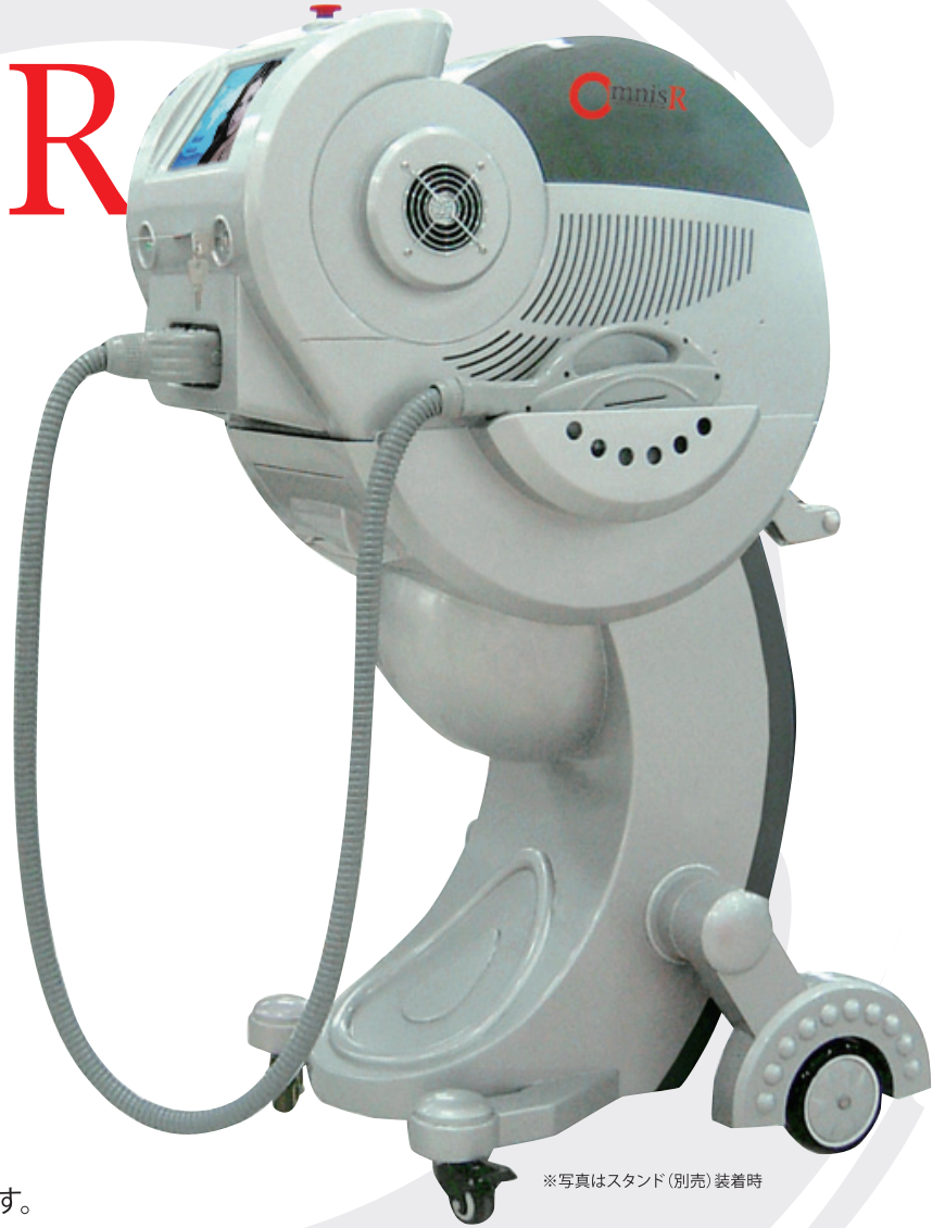
※写真はスタンド(別売)装着時