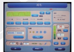
パラメーター自動設定画面(脱毛)